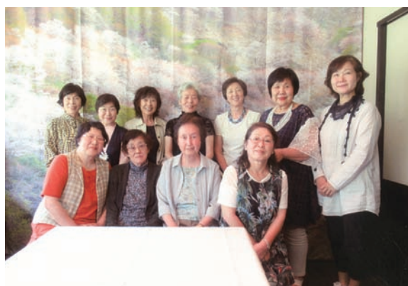
2018年 5月27日 奈良にて

昨年の55回関西支部総会は奈良が会場でした。天候にも恵まれた5月27日(日)会場は、東大寺裏手にあって落ち着いた静かな雰囲気『天平倶楽部』。11名の参加で美味しい日本料理をいただきました。 近年は参加者も少なくなり、メンバーが固定化してまいりましたが、今回は新しい方がきて下さいました。幹事の一人と同期生だったそうです。「同窓」とはいえ、初対面の方々の集まりは不安が大きいもの。そんな中での「同期生」は心丈夫ですね。和やかな雰囲気の中、あつという間に二時間が過ぎてしまいました。帰りは新装になった興福寺の宝物館を見学し、「来年は京都で会いましょう」を合い言葉に散会しました。