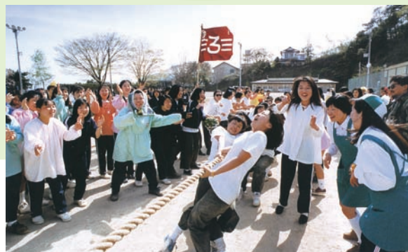
高校47回生 アルバムより

当番幹事は高校23回生・40回生・ 58回生・71回生のみなさんです！ よろしくお願いします。