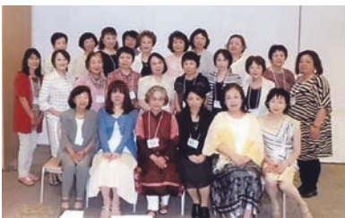
交流会 in 岩手 2015